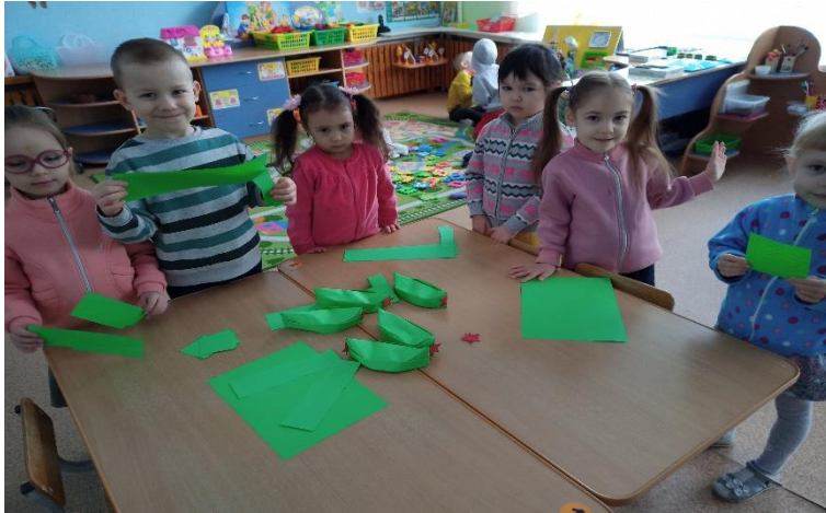
Художественно ручной труд «Подарки папам и дедушкам» Конструирование из счетных палочек «Самолеты», военная крепость .