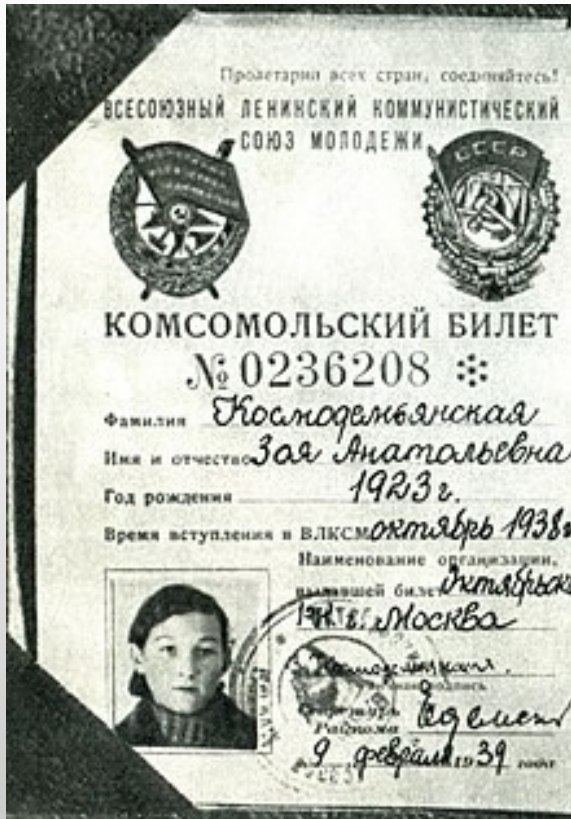
Комсомольский билет Зои Космодемьянской.