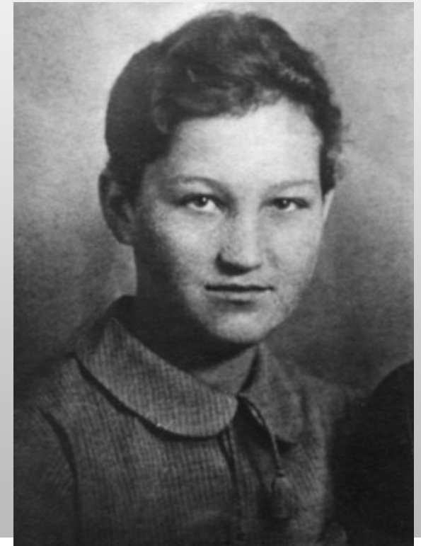
ЗОЯ АНАТОЛЬЕВНА КОСМОДЕМЬЯНСКАЯ (13 СЕНТЯБРЯ 1923 – 29 НОЯБРЯ 1941)