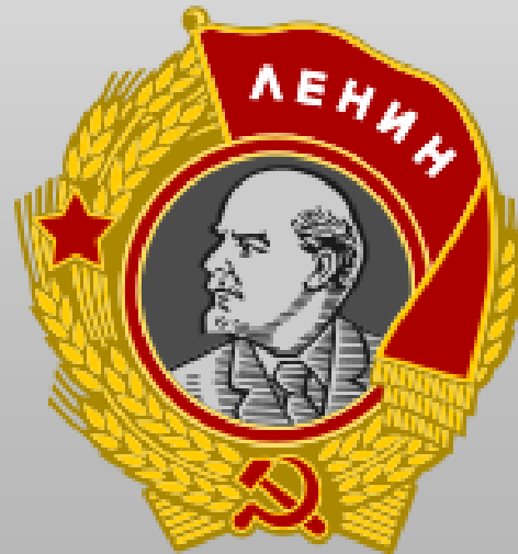
Орден Ленина (посмертно)