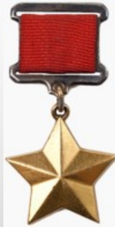
Медаль «Золотая Звезда» Героя Советского Союза